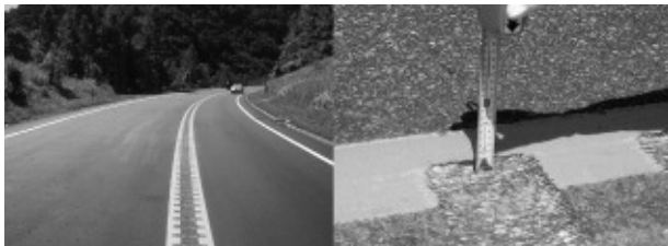
一般国道に設置されたランブルストリップス (左：R 230 札幌市、右：R 275 月形町)

私たちは、このランブルストリップスの車線逸脱防止効果に目を向け、北海道で発生件数の多い正面衝突事故対策としての導入を行ってききましたので、このランブルストリップスとはどういうものかについて解説いたします。