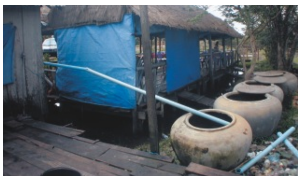
雨水は溜めて使います。何処の家にも必ずある水がめ