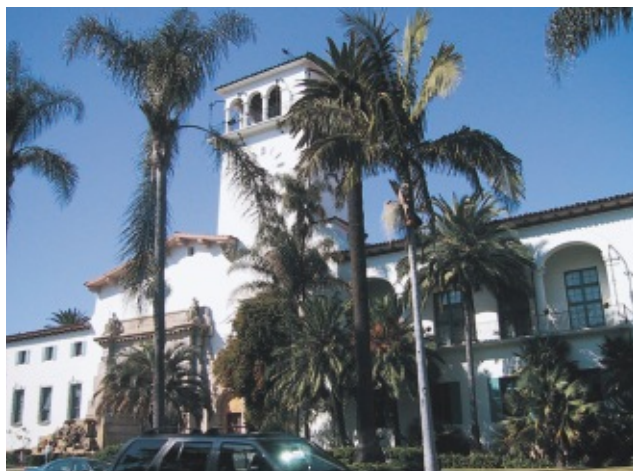
サンタバーバラの市役所 (ここで結婚式を開くカップルもいます)