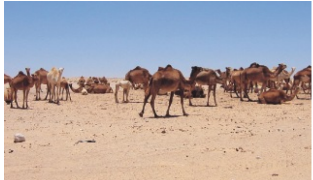
サハラ砂漠で会ったラクダのキャラバン (+50°C)