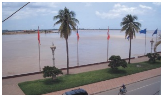
雨期のサップ川とメコン川の合流点 手前がサップ川