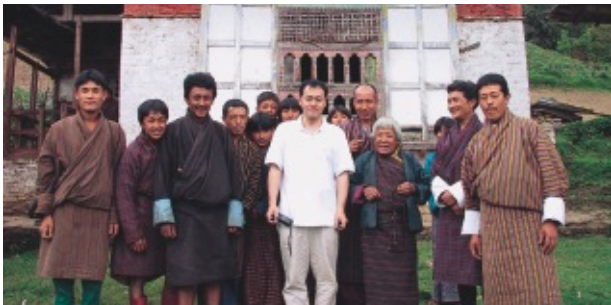
ブータン国ルンチ県ガンズール郡にて。ブータン人は日本人と同じような顔をしている。男は「ゴ」、女は「キラ」という着物みたいな民族衣装の着用が義務づけられている