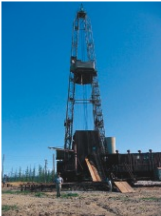
サハ共和国ミールヌイ 郊外の油田跡にて