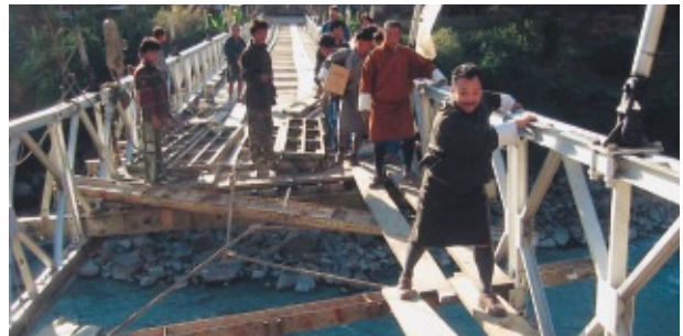
ルンチ県への県道でクリ川に架かるタンマチュー橋。過積載車両によりしばしば損傷する。この橋も日本の無償資金協力での架替えが予定されている