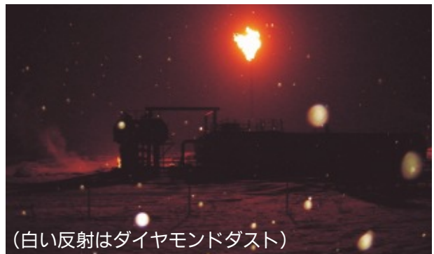
(白い反射はダイヤモンドダスト)