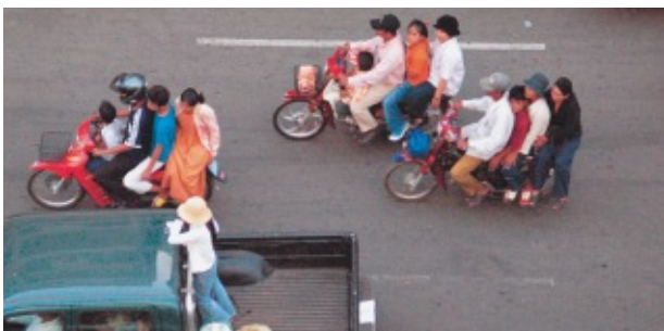
プノンペン市内。一般に途上国では「乗車定員」は無いに等しいが、カンボジアではバイクの4人乗りはごく当たり前。通常、前から子供、父親(運転者)、子供、母親の順