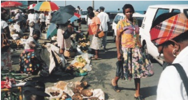
土曜日はマーケットデイ (ドミニカ連邦国)