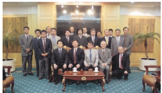
浦東新区管理委員会にて