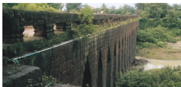
Cambodia で最も古い橋 (内戦時に川を挟んで銃撃戦があったとき、橋には全く弾が当たらなかったという)