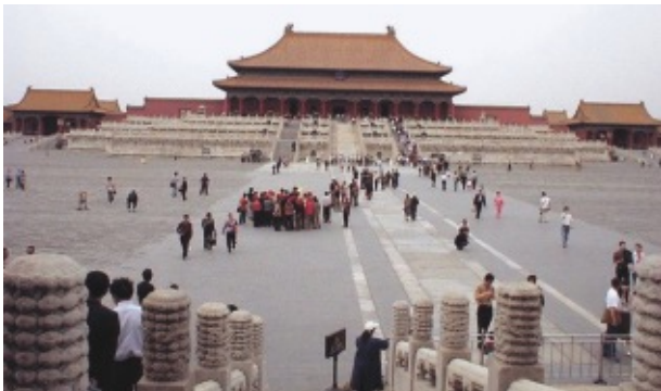
旧き中国（故宮にて）