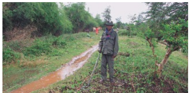
今も内戦時代の不発弾や地雷が散在するカンボジア農村部では、測量やボーリング等の調査前にも探査を実施する。写真は改修予定の堤防上を探査する政府軍工兵隊員