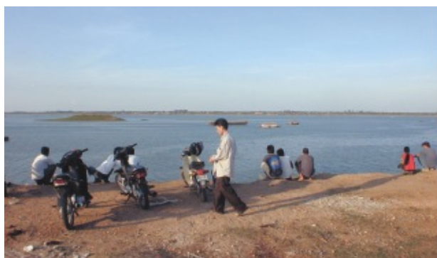
乾期のメコン川 川端で涼む人々