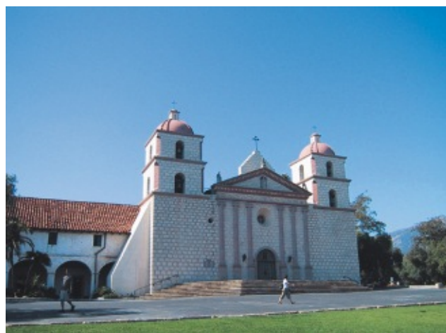
サンタバーバラのミッション (スペイン領時代の修道院で、町のシンボルのような存在です)