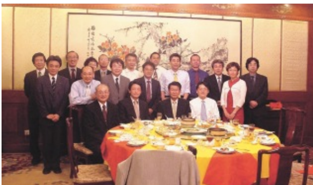
晩餐会（国家環境保護局李主任を囲んで）