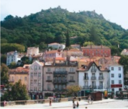
ポルトガルの街並