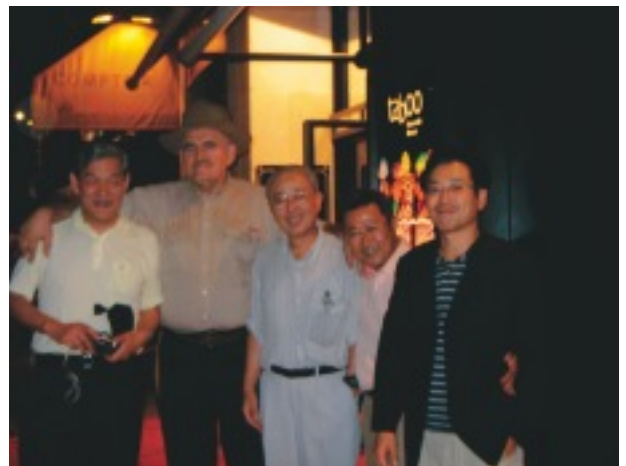
フランスのレストラン前で