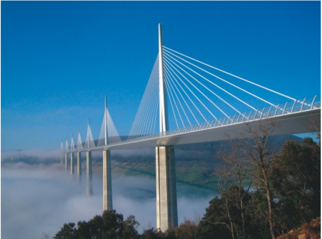
Millau 高架橋