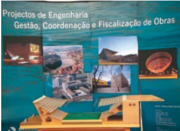
IABSE ポスターセッション風景