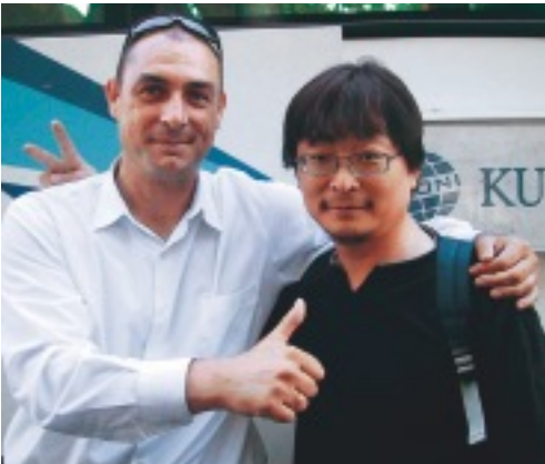
粋な Taxi ドライバーと