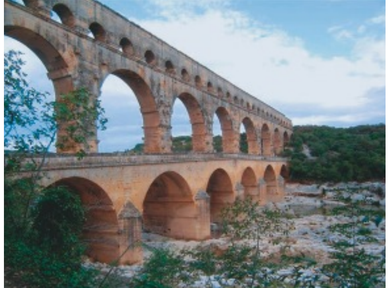
ポン・デュ・ガール (Pont du Gard) 橋【フランス】