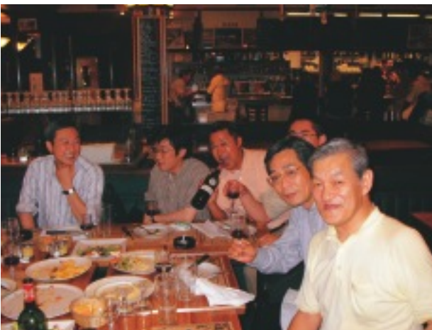
フランスでのディナーにて