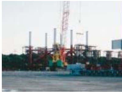
ジャケット製作状況