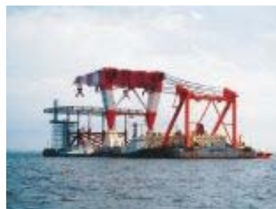
低頭式起重機船 (第28吉田号)