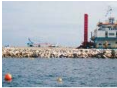
捨石傾斜護岸施工状況