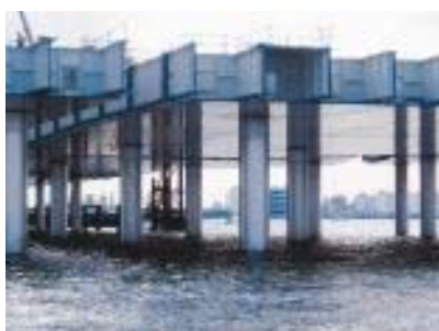
鋼製ジャケット据付状況