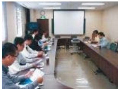
施設の説明を受ける一行