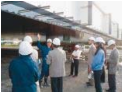
ジャケット製作場で説明を受ける一行