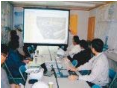
床版製作場で説明を受ける一行