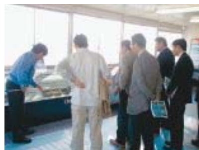
工事の説明を受ける一行