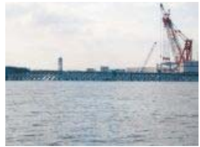
連絡誘導路部施工状況