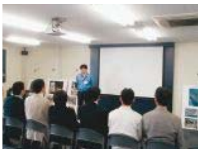
工事の説明を受ける一行