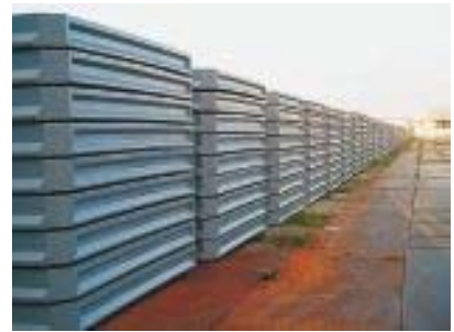
超高強度繊維補強コンクリート床版