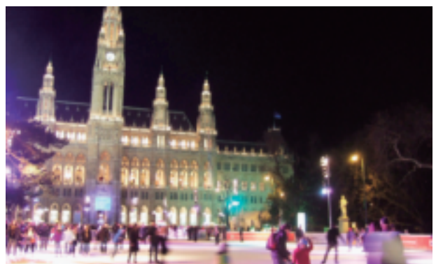
深夜のウィーン市庁舎前の賑わい