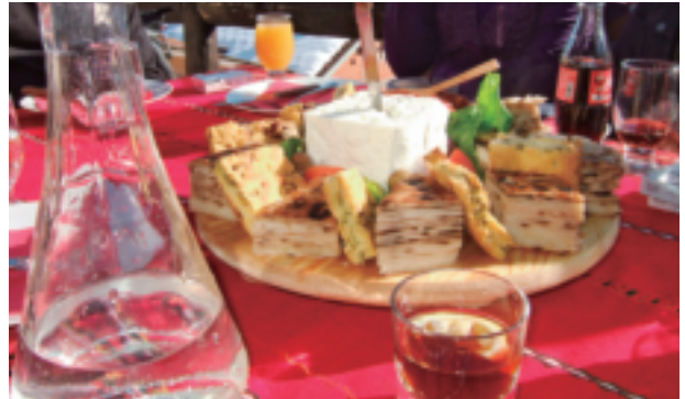
マケドニアの昼食：14時からたっぷり2時間。酒はフルーツで作る蒸留酒ラキア。家庭でも作る。飲めない人でも氷にレモンを浮かべたスイートラキア。