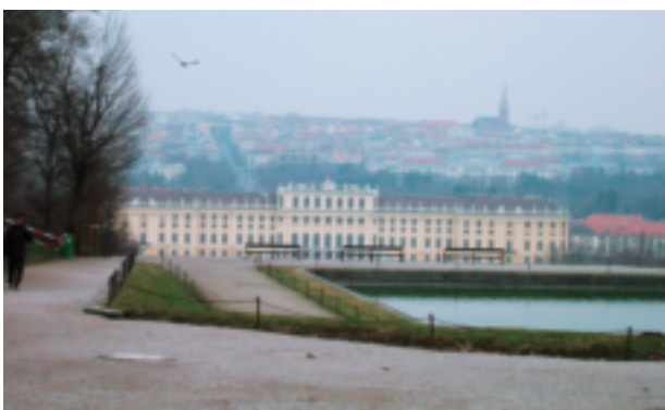
朝霧のシェーンブルン宮殿とウィーン市内