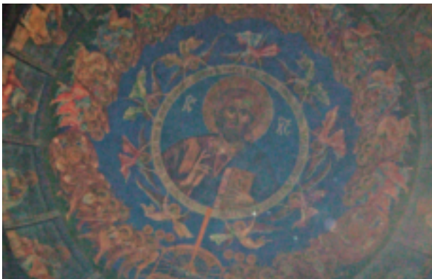
聖クリメント大聖堂内のフラスコ画：数あるフラスコ画の中でこのブルーに最もひかれた。