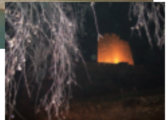
スコピエの城塞：市街が360度見渡せる。夜間もライトアップされている。