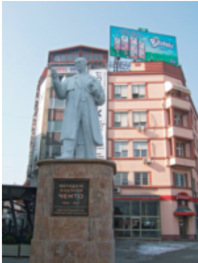
チトーの立像：マケドニアのどの町にもチトーの立像や胸像がある。死後30年経っても、根強い人気がある。