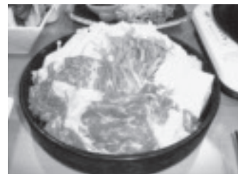
写真-4 白老黒毛和牛しゃぶしゃぶ ご飯、汁物、香物付きで 1人前1980円