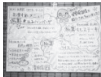
写真-2 おすすめメニュー