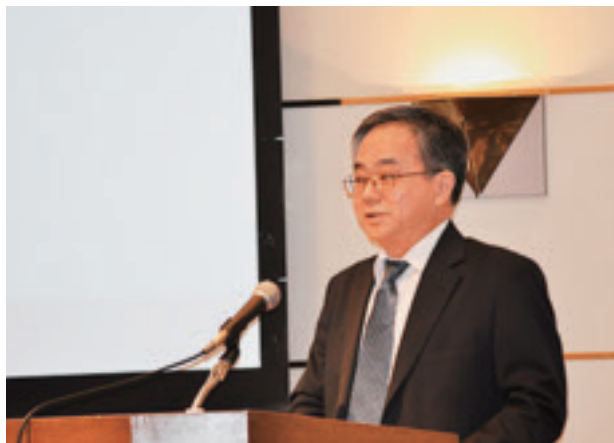
基調講演者 桑江原子力・放射線部会 部会長