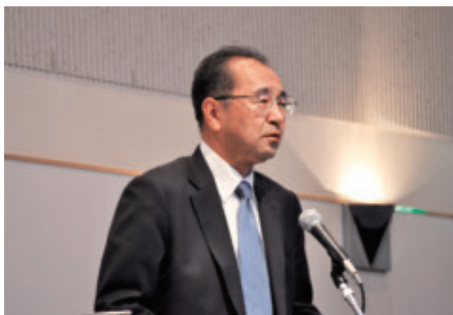
中野副本部長(研究会会員)の閉会挨拶