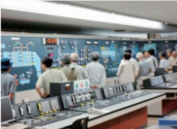
創成川水再生プラザ監視室