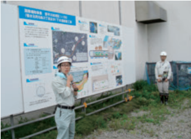
貯留管工事概要の説明