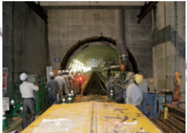
発進立坑・シールドトンネル