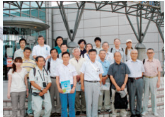
下水道科学館前で記念撮影(2号車)