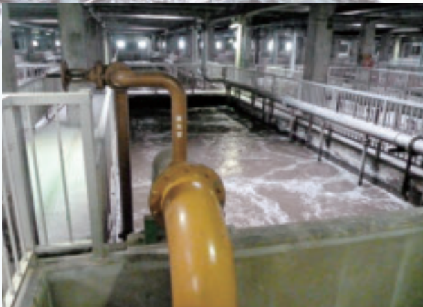
下水処理場内(処理槽)