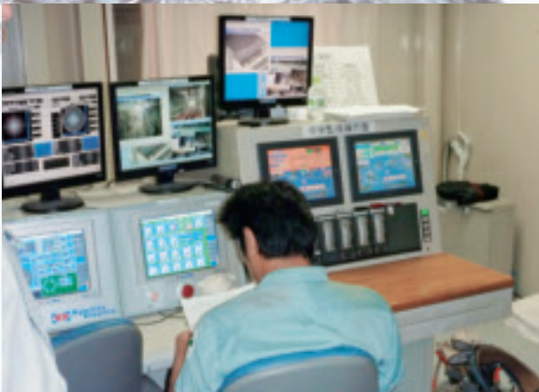
シールドマシン中央制御室