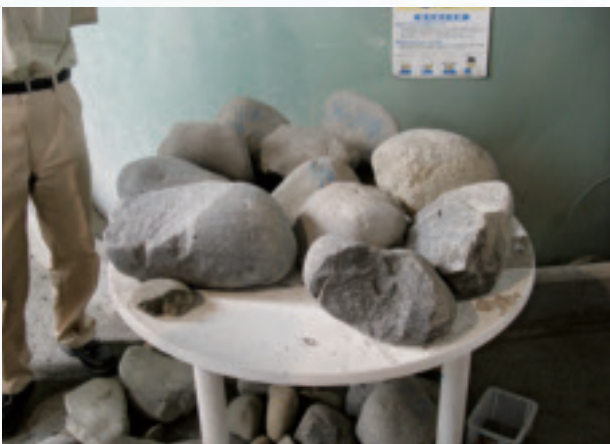
排泥管に詰まった石