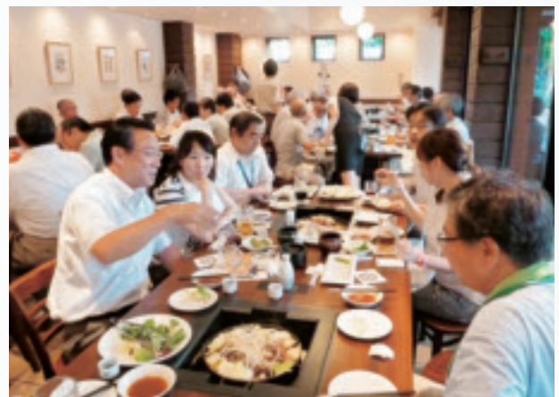
さっぽろビール園での懇親会