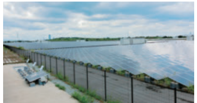
テクニカルツアー 2日目：関西電力メガソーラ