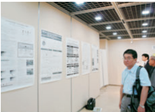
ポスターセッション会場