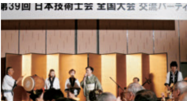
交流パーティ アトラクション(河内音頭)