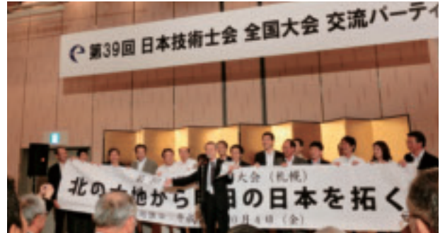
交流パーティ 次回開催(北海道)の紹介