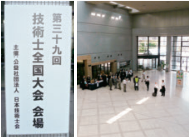
会場アトリウム・受付

開催日：2012年(平成24年)9月21日(金)～24日(月) 会場：大阪国際交流センター