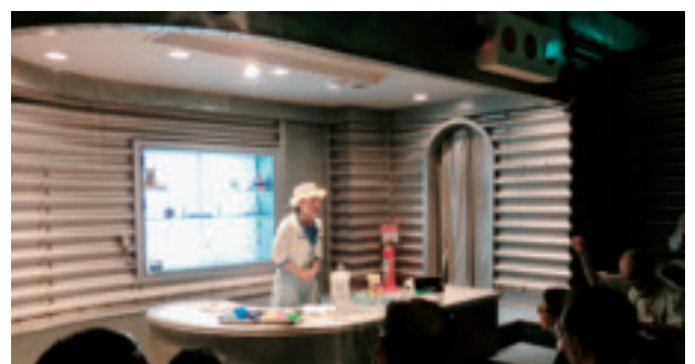
テクニカルツアー 2日目：大阪ガス ガス科学館