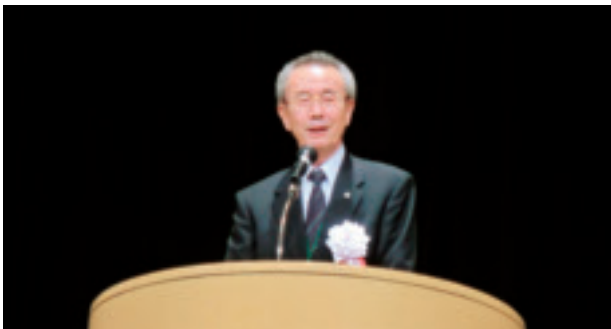
能登副本部長 次回開催挨拶