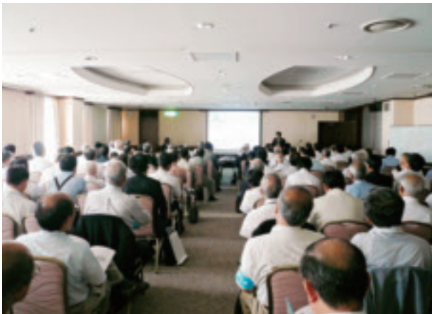
分科会会場(第1分科会)