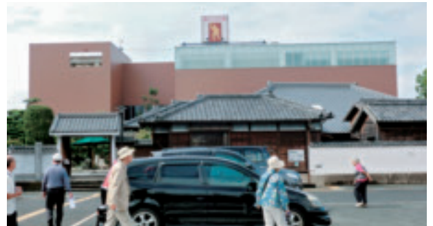
テクニカルツアー 1日目：稲むらの火の館