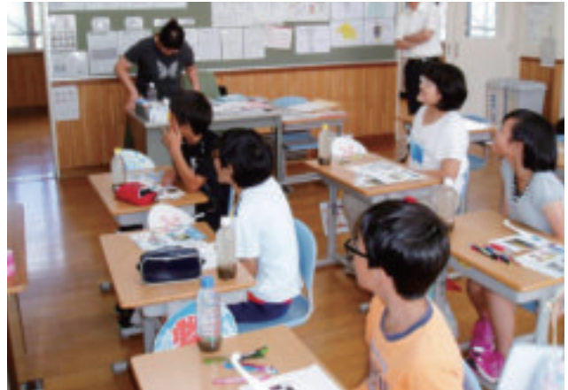
寿都町理科特別講師配置事業