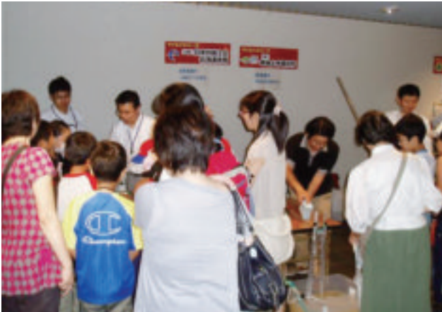
2013 サイエンスパーク会場

開催日：2013年(平成25年)8月22日(木)、26日(月) 会場：寿都小学校、潮路小学校