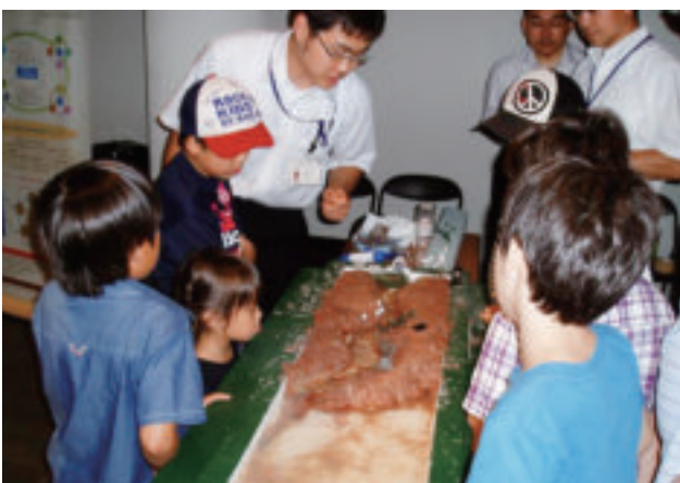
サイエンスパークでの実験