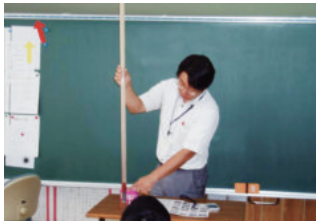
理科授業での実験