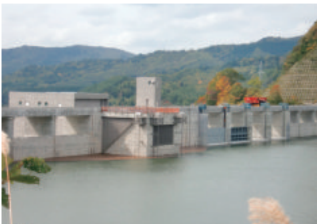
【堰水試験中のシューパーダム仮設ゲート】