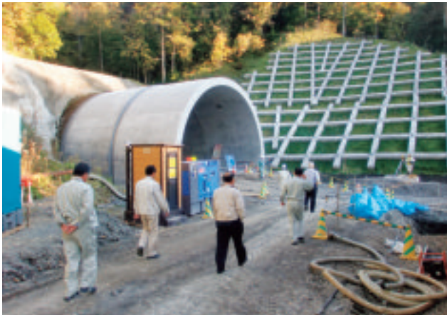
【釧勝トンネル足寄側坑口】