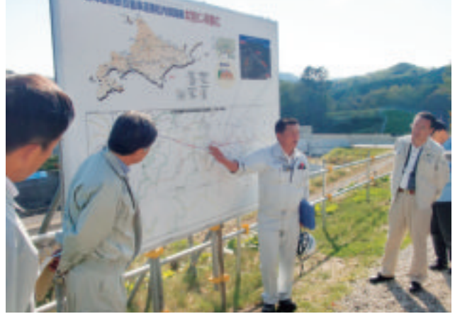
【神課長による釧路道路事務所管内の概要説明】