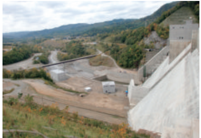
【堰水試験中のシューパーダム下流】