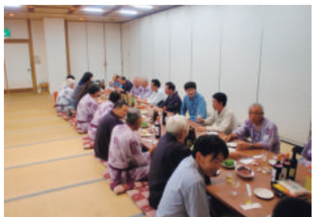
【懇親会 2 次会の様子】