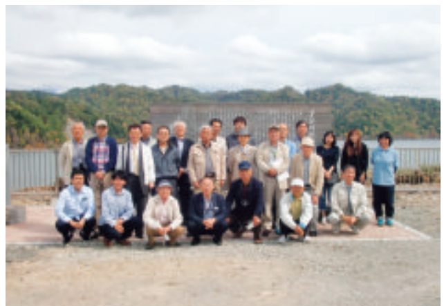
【ダム記念碑前での集合写真】