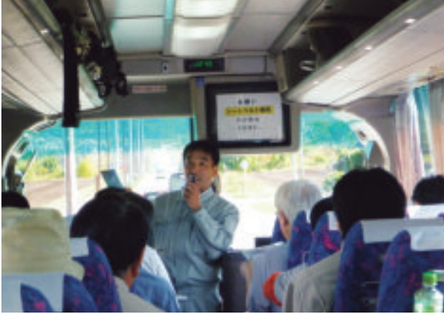
【加藤所長による工事概要説明(移動中の車中)】