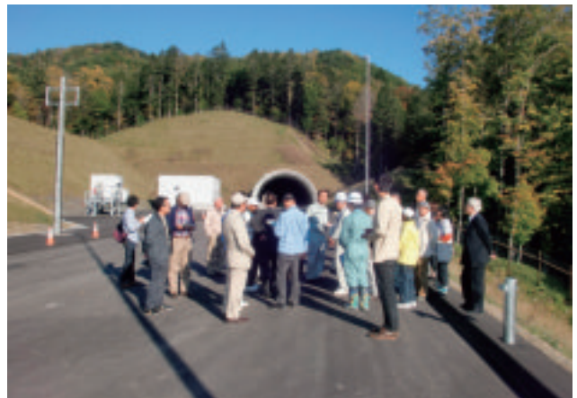
【炭山第1トンネル足寄側坑口】