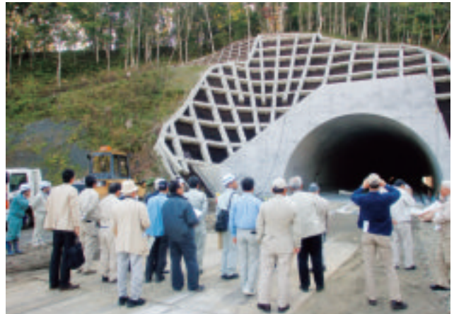
【白音トンネル釧路側坑口】