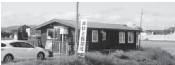
一見小さい店舗、手前に広い駐車場

国道275号を月形方面に走って当別の直角を曲がり、ほどなく行くと左側に「かぼと製麺所」ののぼりが見えます(15時閉店定休日なし、冬季休業：北15西5ほくせいビル1Fの別名の支店は営業)。