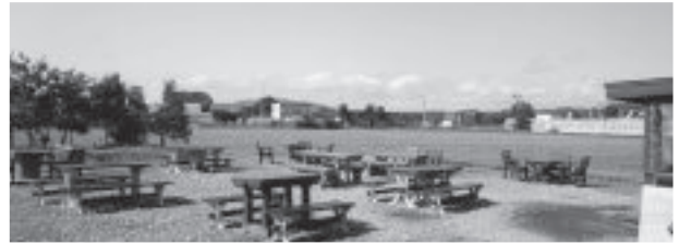
アウトドア派のテーブル席多数

このお店には、店内席、半屋外席、完全屋外席の3種類の席があり、外ほど数が多いのです。