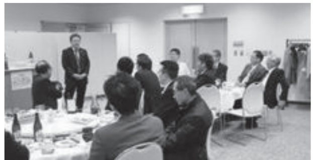
「ワン・ミニッツ・ストーミング」の様子

会場をホテル内の別室に移し、18時より懇親会が行われました。ここでは、各自1分という持ち時間で、近況や今年度の抱負などを発表する「ワン・ミニッツ・ストーミング」の場を設け、談笑を交えながら道南の技術士の熱意を聞くことができました。また、アルコールも加わり、各人の所属する組織の垣根を飛び越え、熱い技術論にも花が咲きました。