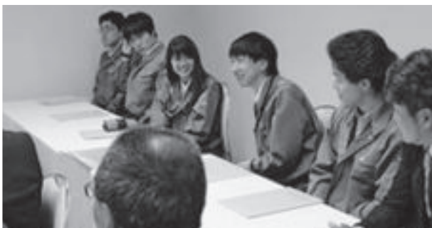
技術発表を受講する道南の若手技術者