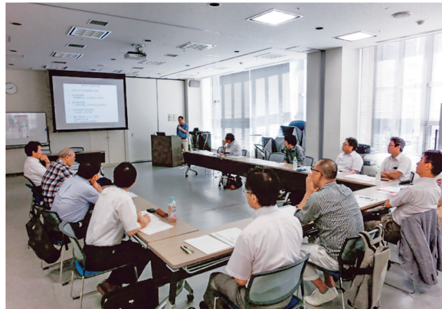
話題提供者のプレゼンを聴講する参加者