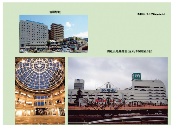
益田駅前や下関シーモールなどは注目すべき駅周辺開発