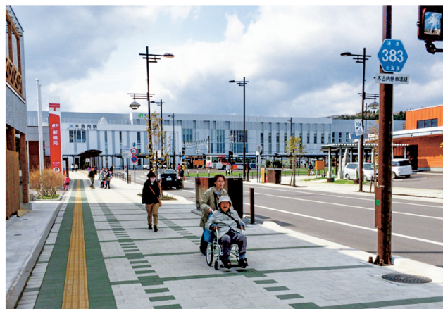
新幹線開業に合わせて整備した木古内駅前(広場、街路)