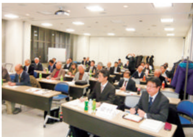
講演会の様子(熱心に聴講する参加者)