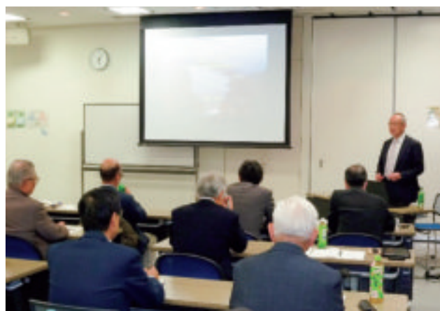
スライドを使用した講演中の風景