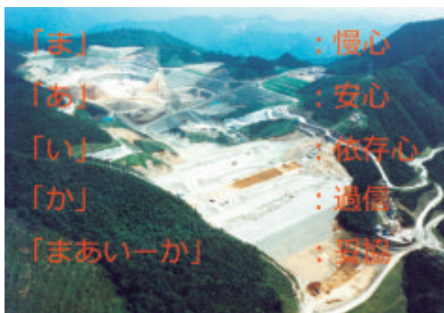
土木屋が失敗から学んだこと： 「まあいーか」はやめよう