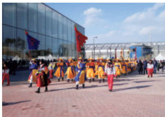
カンヌンオリンピックパークでの一コマ