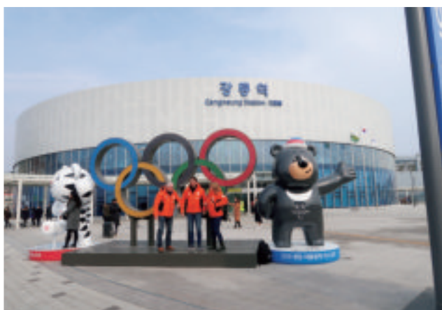
観客を迎える大会マスコット(カンヌン KTX 駅)