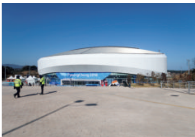
フィギュアスケート会場外観