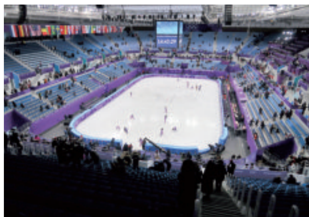
フィギュアスケート会場内観