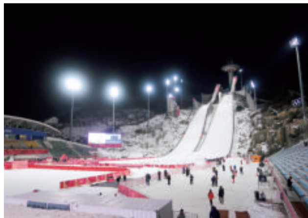
夜間開催で寒かったジャンプ競技会場