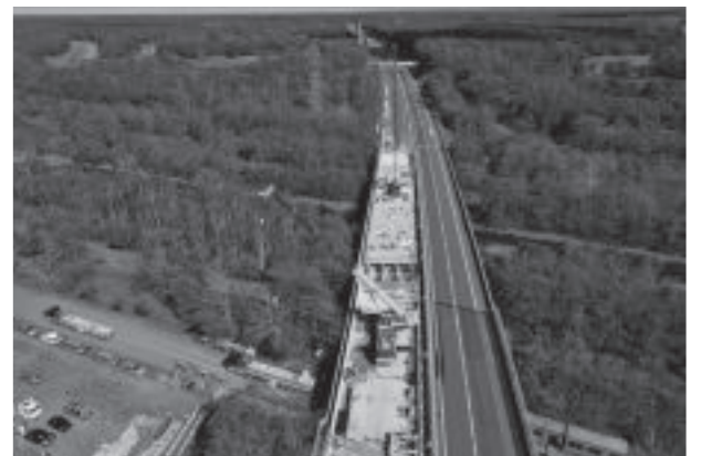
写真-1 床版取替工事の実例(勇払川橋下り線)