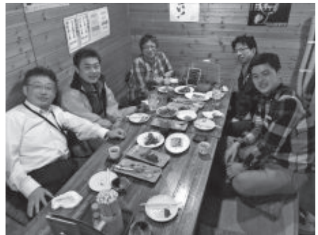
写真-4 懇親会の様子

施設見学後には、道央の会員相互の交流と青技交との親睦を兼ねて懇親会を開催しました。