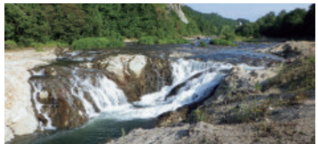
仮称) 藻南公園北の滝【南区】