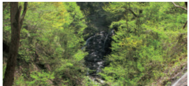
不老の滝(滝野公園)【南区】