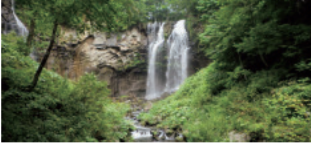
アシリベツの滝(滝野公園)【南区】