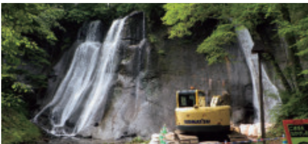
鱒見の滝(滝野公園)【南区】