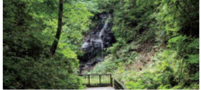
白帆の滝(滝野公園)【南区】