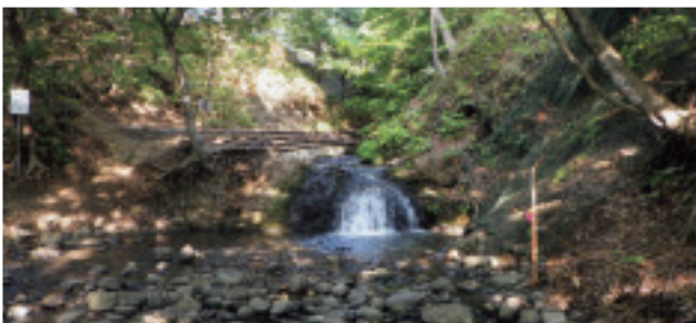
精進川の滝【豊平区】