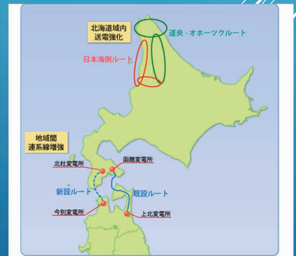
図. 北海道本州地域間送電網強化