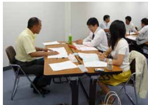
【ロールプレイの様子】

調停人が、話し合いの中で両者の本音を聞きだし、課題を整理し、合意形成を図るための訓練です。